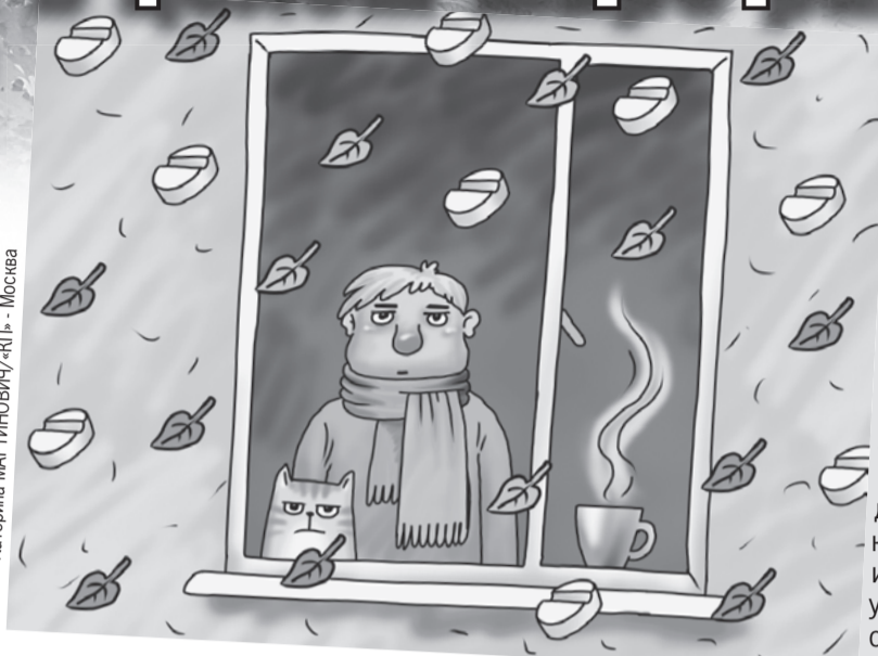
Катерина МАРТИНОВИЧ/«КП» - Москва

Когда проходит: за 5 - 8 дней. Без лечения - 2 - 3 недели.