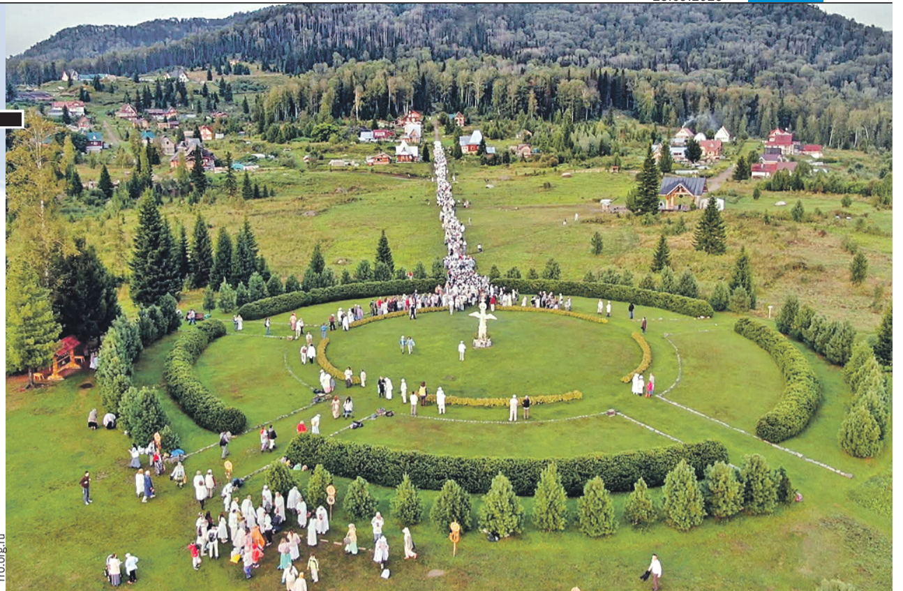
Площадь Ангелов в центре Города Солнца - поселения, основанного Виссарионом. Члены общины собираются там на бдения.

- А сами они видят свою жизнь как максимальное братство: у человека нет секретов от коммуны, на собраниях ты должен рассказывать даже о своей интимной жизни, и если не рассказываешь, то тебя исключают, а это хуже смерти, ведь ты порвал со всем миром, кро-