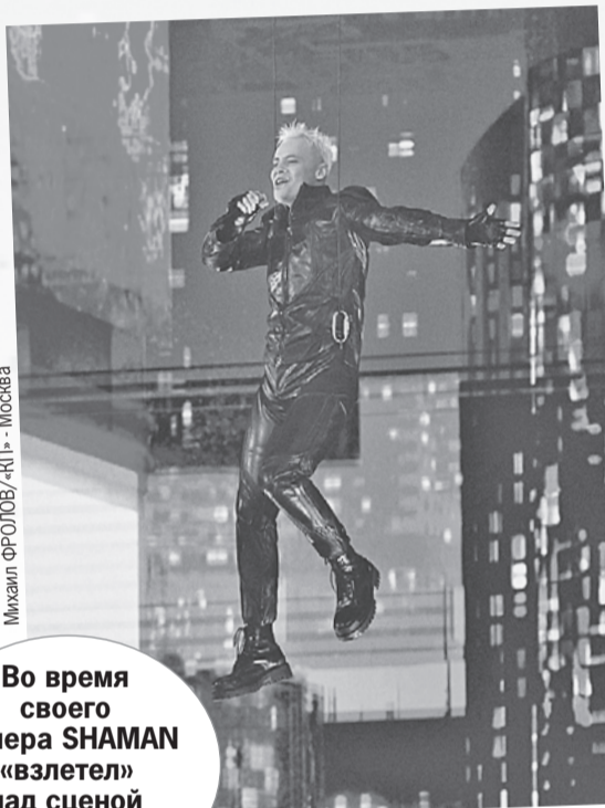
Во время своего номера SHAMAN «взлетел» над сценой метров на пять.

вне российской территории, есть. В отличие от «Евровидения», у нас победившая страна не принимает эстафету и не проводит конкурс на следующий год - так что «Интервидение-2026» пройдет в Саудовской Аравии, которая вызвалась принять проект. В Москве была задана весьма высокая планка: бюджет в 750 млн рублей заметно ощу-