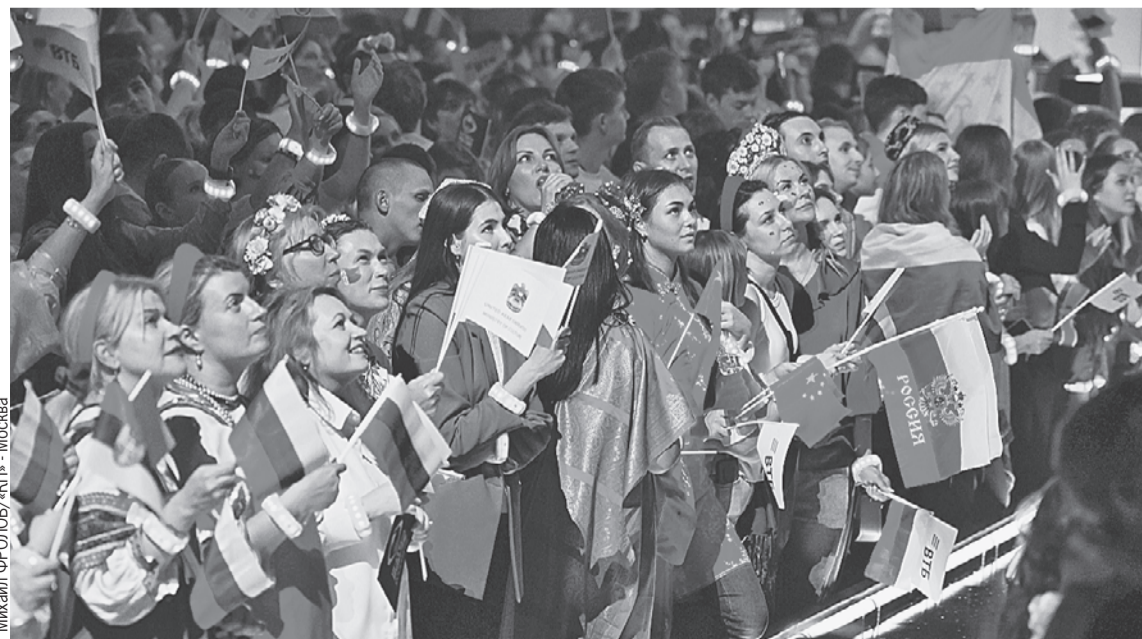
«Live Арена» вмещает около 11 тысяч зрителей. Продажи билетов начались еще летом.

По правде говоря, в этом жесте есть нечто претенциозное. Ну очень высокое благородство - вот так взять и отдать как будто предсказуемую победу соперникам. Это, безусловно, поступок. Скажем, выиграл бы SHAMAN этот конкурс. Что бы мы услышали изо всех утюгов?