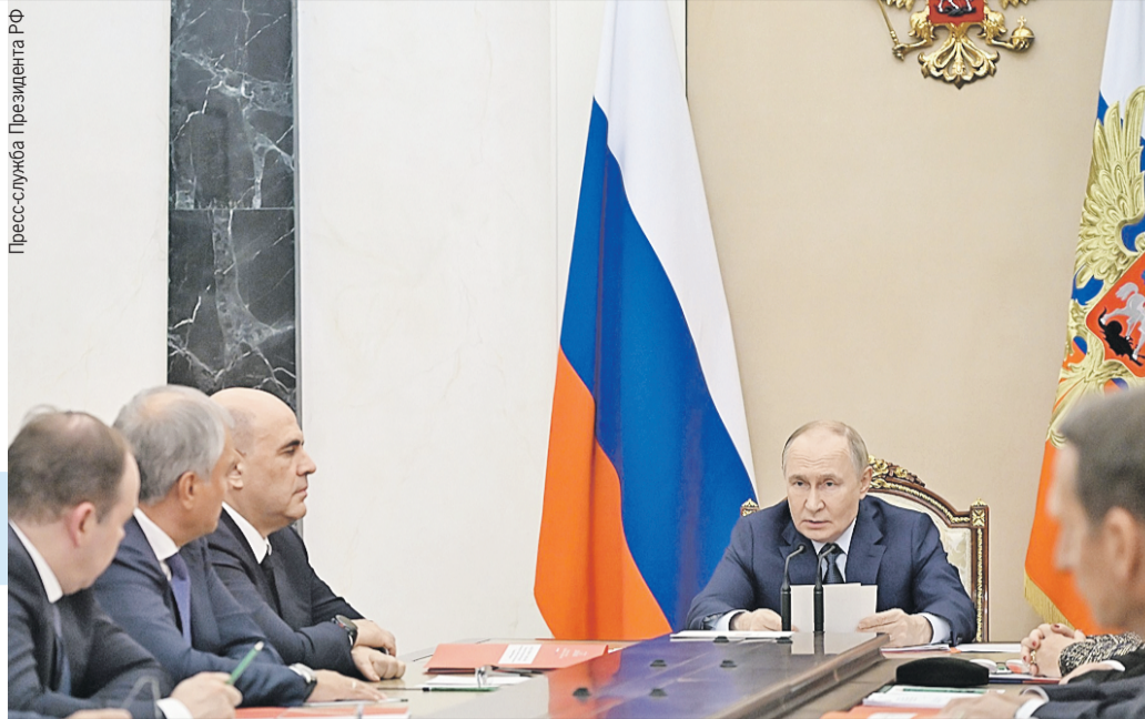
На Совете безопасности Владимир Путин подчеркнул: до истечения последнего договора в сфере ядерного оружия осталось меньше полугода...