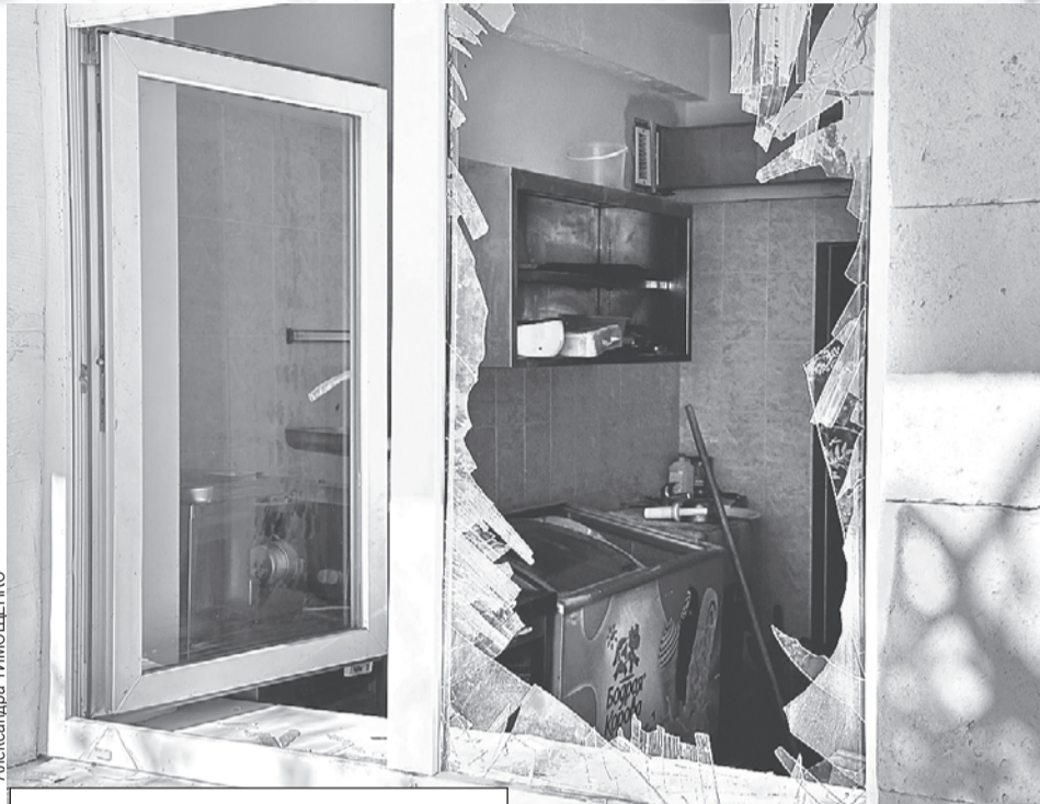
Где здесь ВСУ увидели врага?!

- У всех пострадавших осколочные ранения. Эти люди находились на береговой линии Фороса в момент атаки. Это и наши, и гости поселка, есть граждане Республики Беларусь, - рассказала мэр Ялты Янина Павленко.